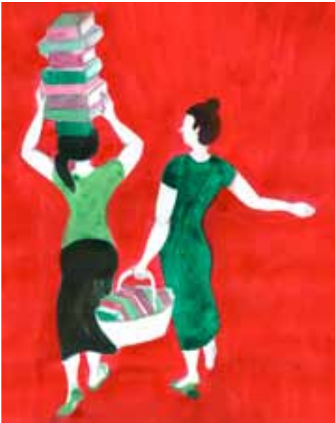
Revenir du marché

Quels sont les liens entre lecture et jardinage? acrylique et encre sur papier, 2015