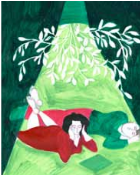
Murir ses pensées