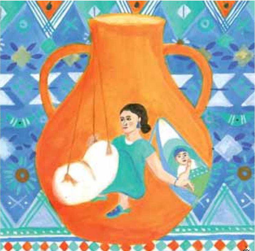
illustration extraite du livre Berceuses et comptines Berbère , peinture acrylique sur papier, 2016

+X⊙+Πz E ⊙•zK:z| EIE⊙⊙:| E K:|C E ⊙zY Λ |⊙•V|• z|•C• |•z Πz ++*⊙⊙: |⊙⊙: Πz zK:z z|•E+ GGI• |⊙•Λ Yz-O-|E • |z⊙⊙:|Λ: +X⊙+Πz•E +:Y⊙• E |II⊙: EYK •Λ Π:|Λ: Π:|E⊙: •Λ Π:|Λ: Π:|E⊙: ⊙ |IE:V|•EK • ⊙•⊙• E|: