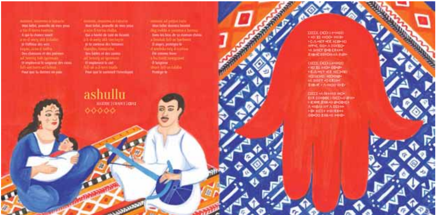
illustration extraite du livre Berceuses et comptines Berbère , peinture acrylique sur papier, 2016